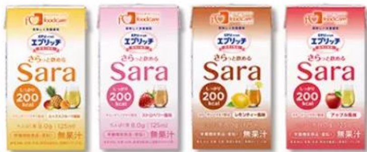
ミックスフルーツ風味 ストロベリー風味 レモンティー風味 アップル風味